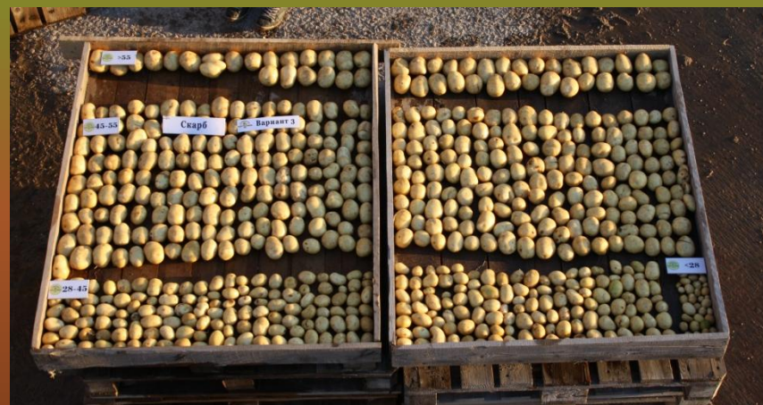
Карбон + Fostrak